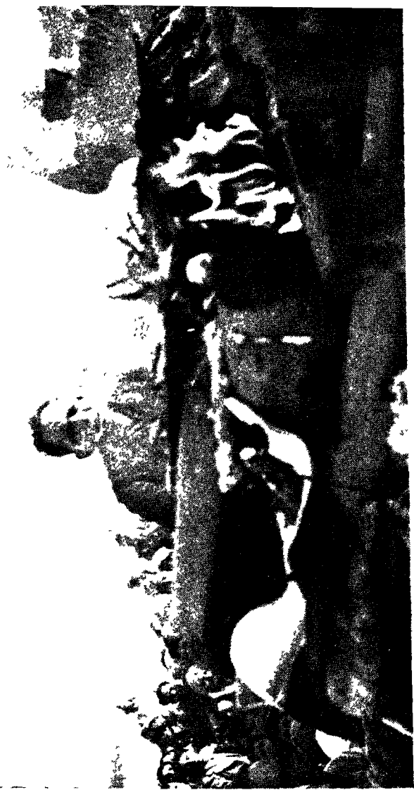
बापू का अग्नि-संस्कार